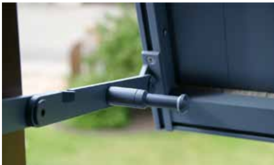
Je nach Breite Ausstellung mit beiden Händen oder mit Hebel